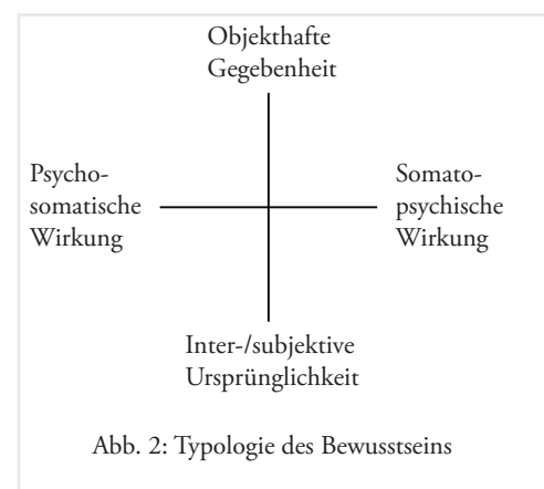
Abb. 2: Typologie des Bewusstseins

Rückwirkend bekräftigt die dargestellte Systematik der Bewusstseinstheorien das eingangs zu Grunde gelegte Verhältnis der Gegenstandsbereiche und ihrer Relationen. Der unvoreingenommene Blick auf unser Bewusstsein kommt nicht umhin, Indizien für die Relevanz seiner vier typischen phänomenalen Gesten anzuerkennen. Für eine vollständige Phänomenologie unseres Bewusstseins lassen sich die Faktoren objekthafter Gegebenheit, (inter-) subjektiver Ursprünglichkeit sowie somatopsychischer und psychosomatischer Effekte unterscheiden (Abb. 2). Ohne deren grundsätzliche Relevanz in Frage zu stellen, heißt das andererseits, dass diese vier Faktoren nicht notwendig unter gleichen Bedingungen oder zur gleichen Zeit zu beobachten sind – so wie sich die ihnen korrespondierenden Bewusstseinstheorien wechselseitig ausschließen. Die aufgewiesene Isomorphie zwischen der Systematik der Bewusstseinstheorien und der Typologie des Bewusstseins wird hier als provisorische Definition des Bewusstseins verstanden. Als Systematik der Bewusstseinstheorien ist sie freilich selbst noch keine Bewusstseinstheorie. Und als Typologie gibt sie noch keinen Aufschluss über die prozessualen Relationen zwischen Gehirn und Bewusstsein. Sie erfüllt aber den Zweck, eine erste, dem Portrait des Gehirns gegenüber zu stellende Charakterskizze des menschlichen Bewusstseins zu bieten.